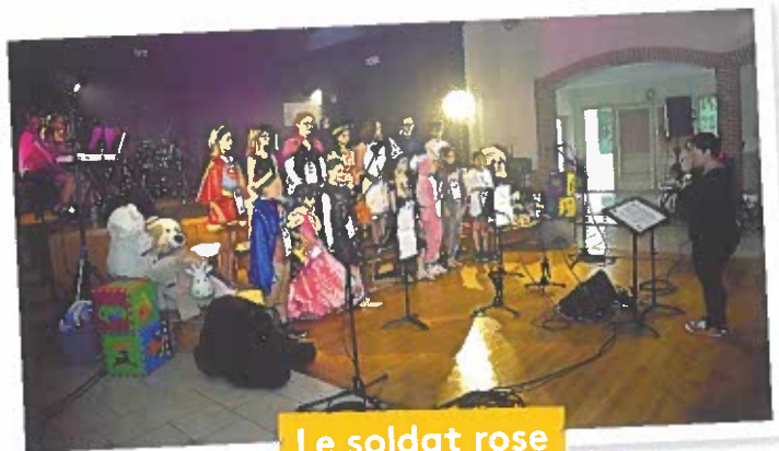
Le soldat rose

La salle du Fournil à Maslives accueille la classe de violoncelle le mercredi après-midi. Suivant les années, elle accueille également une classe de Formation Musicale.