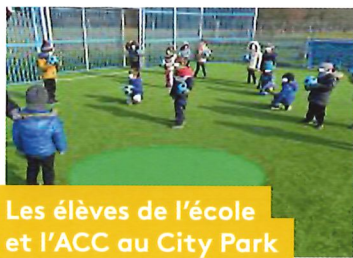
Les élèves de l'école et l'ACC au City Park

Bien d'autres actualités à venir avec l'organisation :